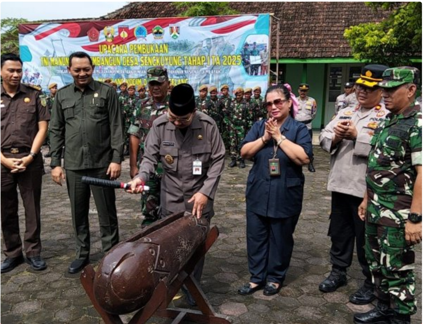
(Foto Dokumen) : Wakil Walikota Magelang didampingi Forkopimda memukul kentongan saat Upacara Pembukaan TMMD

MAGELANG - TMMD Sengkuyung Tahap I Kota Magelang secara resmi telah dibuka. Hal ini ditandai dengan digelarnya Upacara Pembukaan TMMD Sengkuyung Tahap I Tahun 2025 di Halaman SD Kartika III-3, Jl. Kapten Suparman, Kelurahan Potrobangsari, Kecamatan Magelang Utara, Kota